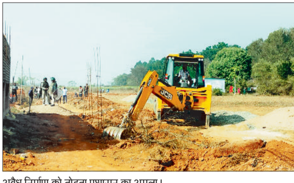
अवैध निर्माण को तोड़ता प्रशासन का अमला।

नहीं कर सकी जिसका निर्णय पेनल्टी शूट-आउट द्वारा हुआ। इसमें सरस्वती महाविद्यालय ने 4-3 से विजय प्राप्त की। दूसरे मुकाबले में पिछले दो बार के चैंपियन रहे शासकीय विजय भूषण सिंहदेव कन्या महाविद्यालय, जशपुर नगर एवं शासकीय महाविद्यालय, शंकरगढ़ के बीच मैच खेला गया विजय भूषण कॉलेज के खिलाड़ियों को गोल करने के कई मौकों मिले उसे गोल में नहीं भुना सकी फिर से मैच का निर्णय पेनाल्टी शूट आउट से किया गया जिसमें 4-2 से शंकरगढ़ की टीम मैच अपने नाम कर लिया। फाइनल मुकाबला शासकीय महाविद्यालय शंकरगढ़ और सरस्वती महाविद्यालय अंबिकापुर के बीच खेला गया, यह मुकाबला भी संघर्ष पूर्ण रहा और निर्धारित समय सीमा में दोनों टीमों ने कोई गोल नहीं कर सकी और निर्णय पेनल्टी शूट से 4 पर